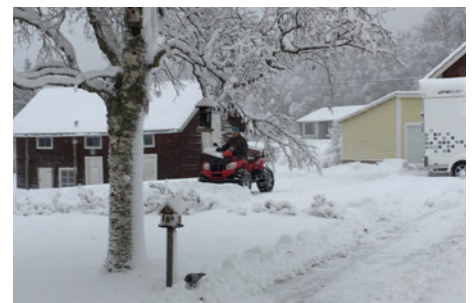
De foto's hierboven: Dressuur op Stockholm Horse show, Stockholm in kerstfeer, De quad en ik in de sneeuw

Meer foto's vindt je op onze website: www.natureartproductions.com en op Facebook Als u de nieuwsbrief niet meer wilt ontvangen stuur ons dan even een mailtje.