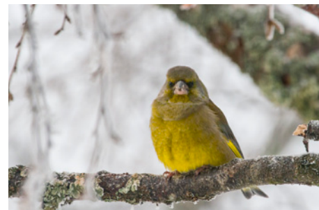
Op de grote foto; Reeën. Kleine foto's; rendieren, Auerhaan, Groenling