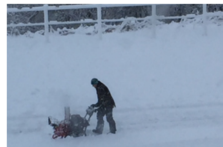
De foto's hierboven: Wandelen met de paarden, Gentle in een sneeuwobui, Sneeuwruimen in de rijbak