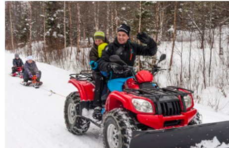
De foto's hierboven: genieten in de sneeuw, Iglo bouwen op het ijs van het meer, met de quad weer omhoog van het meer naar het huis