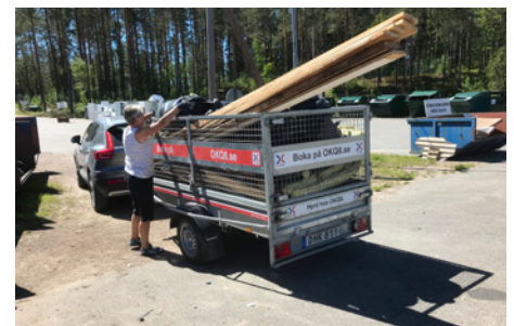
De foto's hierboven: Marsvrouwtjes in Byn, Slopen van de oude stalboxen, afvoeren van het afval

Meer foto's vindt je op onze website: www.natureartproductions.com en op Facebook Als u de nieuwsbrief niet meer wilt ontvangen stuur ons dan even een mailtje.