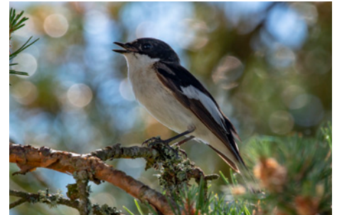
De foto's hierboven: Akkerparelmoerolinder, Grauwe Klawier, Bonte Vliegenvanger