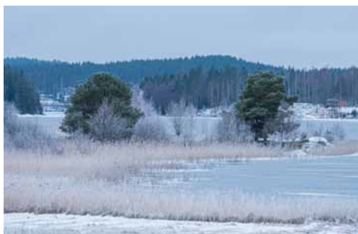
Nog echt winterweer bij het meer

De reeën zijn er wel altijd en slapen in de nacht ook vaak in de buurt van ons huis. Dan hoeven ze 's morgens ook niet zo ver te lopen voor het ontbijt als dat geserveerd wordt. Momenteel zijn er 10 stuks die regelmatig komen eten.