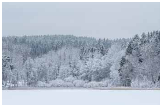
Winter aan het meer