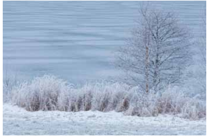
Langs de oever van het meer