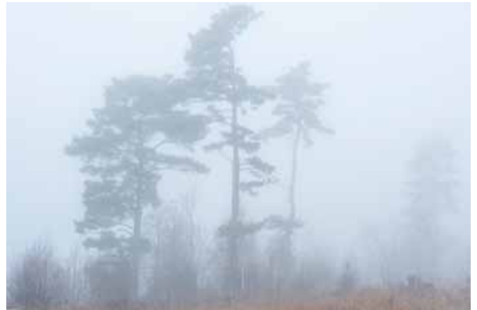
Mist in Byn