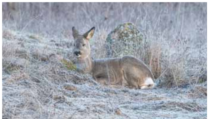
Uitbuiken na het eten