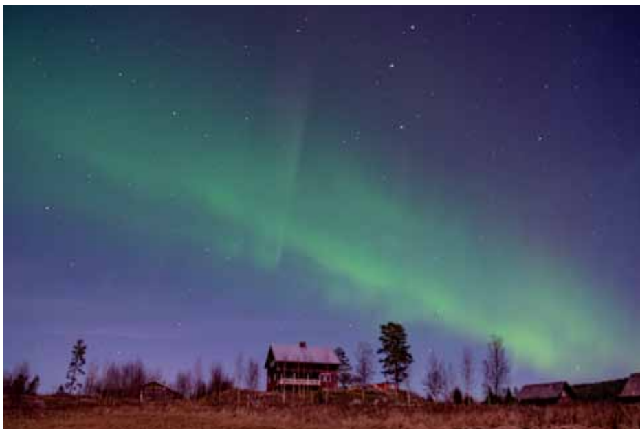
Noorderlicht achter ons huis

Door deze weersomstandigheden kunnen we weinig ondernemen. Volgende week gaan we naar Jämtland en daar is het nog wel stevig winter, dat wordt dus genieten.