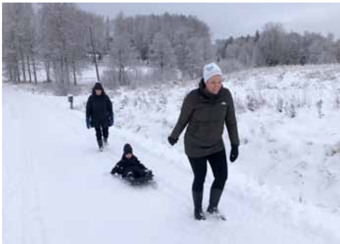
Wandelen in de sneeuw

Meer foto's vindt je op onze website: www.natureartproductions.com en op Facebook