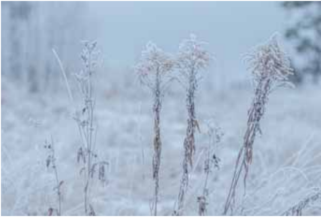
Berijpte planten, Byn