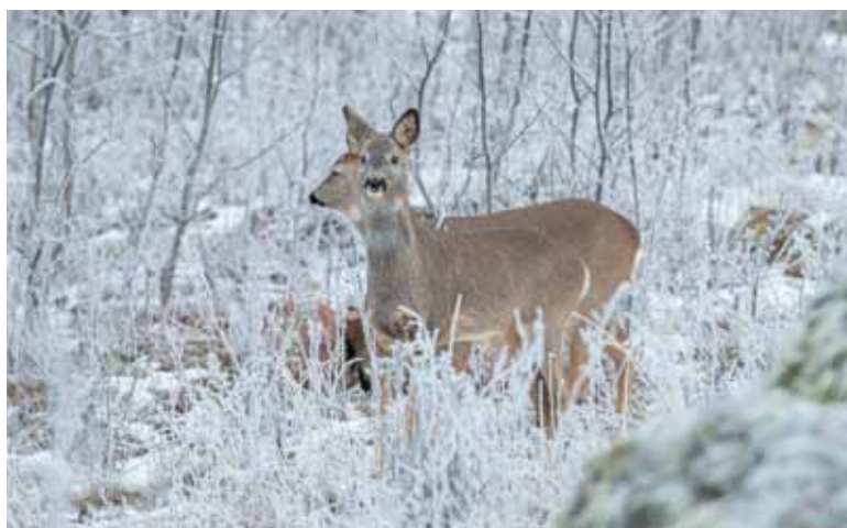
Reeën in een winterse sfeer

Deze maand hebben we voor het eerst noorderlicht kunnen waarnemen hier bij ons huis. Het was geen groot spektakel zoals je wel op internet voorbij ziet komen, maar wel leuk om even van te genieten. We hopen op meer, want dit jaar is het noorderlicht erg actief en ver zuidelijk zichtbaar. De kans om het straks in Jämtland waar te nemen is ook erg groot. Als het tenminste helder weer is.