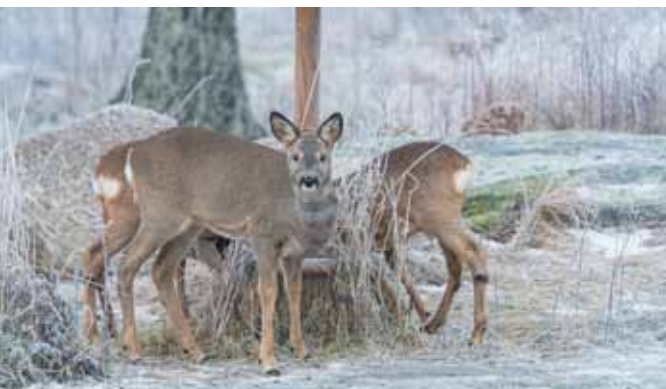
De reeën zoeken voedsel onder de vogelvoerplank