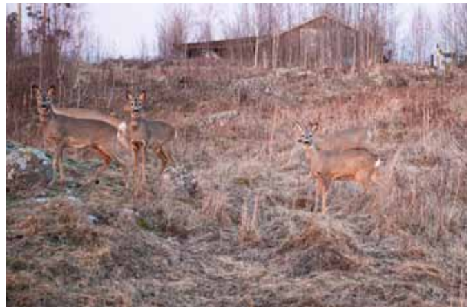
Reeën achter ons huis