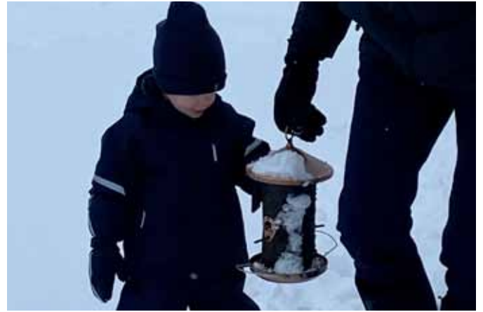
Opa helpen met de vogeltjes voeren

even kijken al we er langs kwamen. Helaas was het niet van lange duur en smolt de sneeuw en de sneeuwpop helemaal weg. Nadeel hiervan is dat de grond hard bevroren is door de voorgaande koude periode, dan ontstaat er ijs op de plekken waar de sneeuw is vastgelopen. En ook de weg is dan een ijsbaan, slecht om te kunnen wandelen.