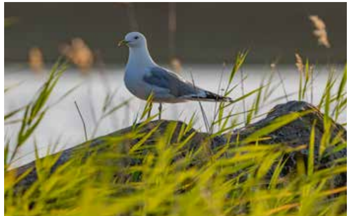
Stormmeeuw in avondlicht