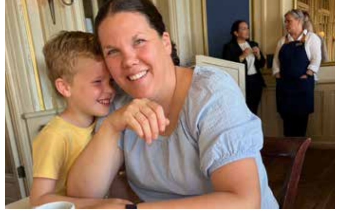
Smoezen met mama in Stockholm