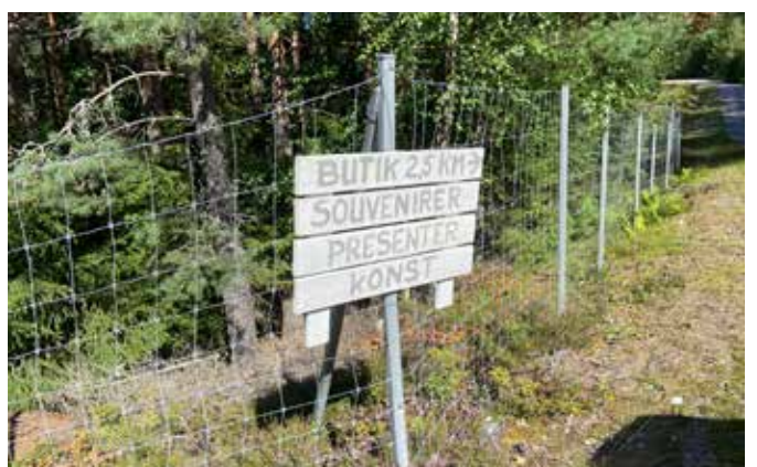
Reklamebord langs de E18 voor onze butik