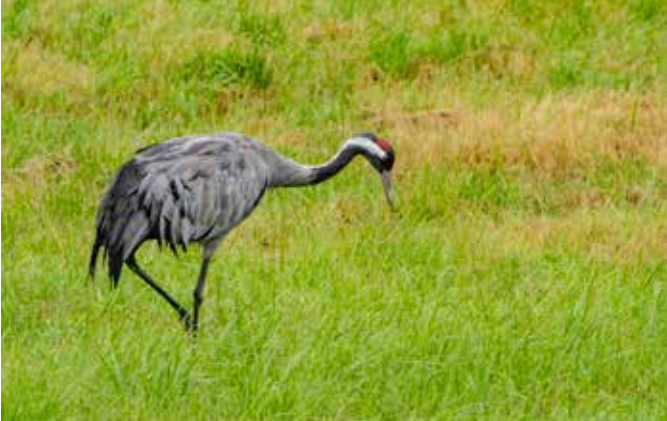
Kraanvogel op ons weiland