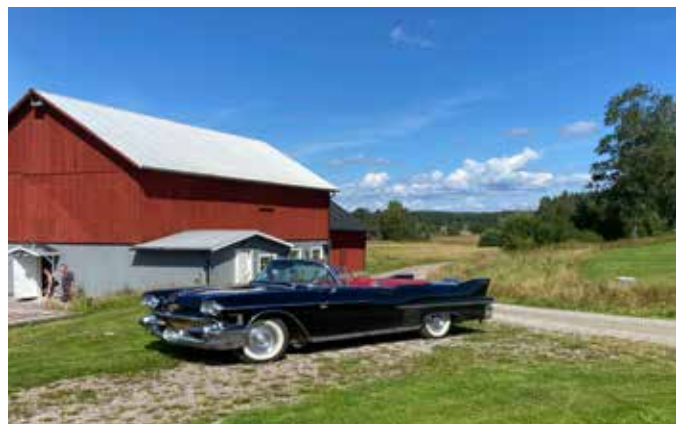
Bezoek in de winkel met een oldtimer