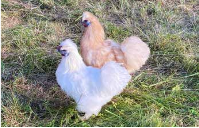
Dit zijn B1 en B2, de zijdehaantjes