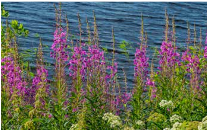
Wilgenroosjes in bloei