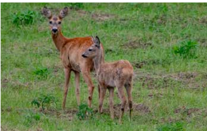
Reeget met 1 van de 2 jongen