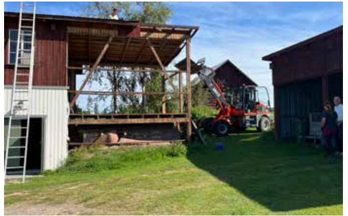
Hulp van de burens bij het weghalen van de dakplaten