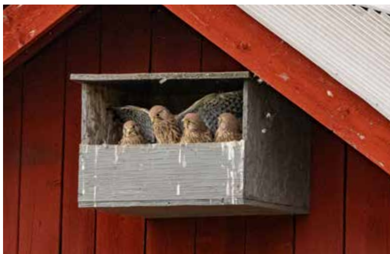
De vier jonge valken in de nestkast, ze zijn bijna vliegvlug