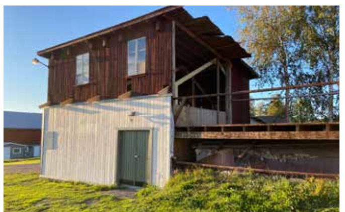
De garage vordert gestaag