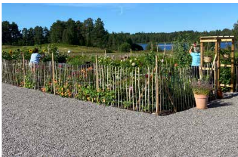
Oogsten uit eigen tuin

Het plan is om volgende maand in een stand te gaan staan op de jaarmarkt in Årjäng. We denken dat dit een positieve werking zal hebben op onze naamsbekendheid.