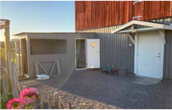
Kippenhok in aanbouw, bijna klaar!