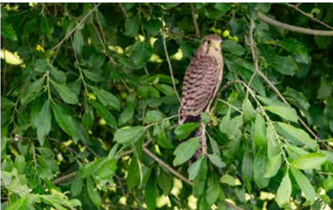
Jonge, pas uitgevlogen torenvalk