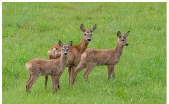
Reeget met 2 jongen, een mooi stel